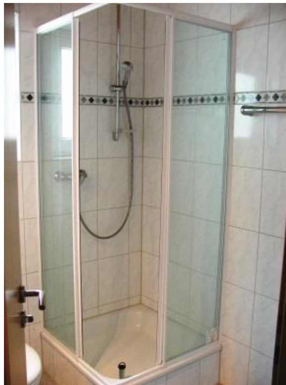
Badezimmer im OG mit Dusche + WC + Waschbecken

BRÜCK-IMMOBILIEN Grasbrunner Str. 1 in 85640 Putzbrunn bei München