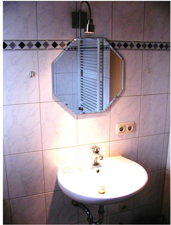
Badezimmer im EG mit Badewanne + WC + Waschbecken