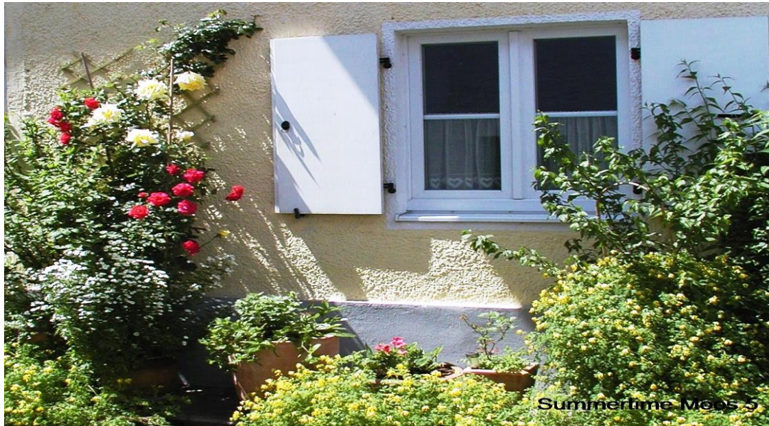
Objekt Nr. 4351