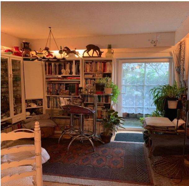
Bibliothek mit Zugang zur Terrasse